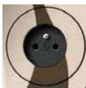
199-66699 Zásuvka 230 V kryt s bezp. clonkami