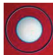
199-38101 Orientační LED osvětlení