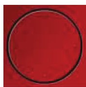
199-00199 Tlačítko bezpotenciálové

Všechny výrobky jsou úplně zapuštěné a velmi nenápadné. Přístroje lze barevně upravit a designově sladit s interiérem.